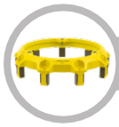
Cover - Pull Type