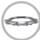
Pressure Plate Face: