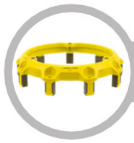
Cover - Pull Type