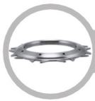
Pressure Plate Face: